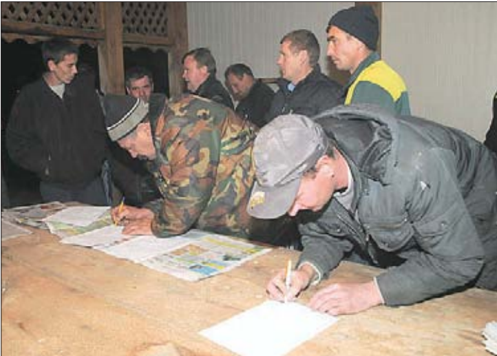
Работники ООО «Тургеневский» пишут очередную жалобу в полицию

диторов, претендующих на свою долю в конкурсной массе, несколько. Но основной — налоговая инспекция. Она же дет двадцать с лишним миллионов рублей от Переплетова. Остальным «Красная звезда» должна от 500 тысяч до 1,5 миллиона рублей. Но эти мизерные, в сравнении с налоговой системой, пакеты голосов все же позволяют остальным всем вместе и порознь вносить изменения в повестку дня собрания. На нынешнем собрании с такой инициативой вышло ООО «Тургеневский». Этот кредитор предлагает, в частности, провести ряд процедур, которые позволят устранить от исполнения обязанностей конкурсного управляющего — за бездействие и за весьма сомнительные действия по уборке чужого урожая с земельного участка, закреплен-