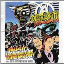
Aerosmith Music From Another Dimension, 2012

Ура, ура. Свершилось, случилось. Выйдя из восьмилетнего анабиоза, Aerosmith выпустили новый альбом. Чем музыканты занимались всё это время? Ничем полезным не занимались. И даже увлеклись скандалами, в результате которых вокалист Стивен Тайлер ушел из группы. Но потом одумался. Помирившись, музыканты заперлись в студии и записали новый альбом. Если честно, то считаю, что в их коллекции есть диски и посильнее. Тот же Toys In The Attic 1973 (по-моему) года — весь выполненный в хард-роковой манере. Или предпоследняя работа Honk in' On Bobo — т-яжелый перепев классических блюзов. В чем, на мой взгляд, их преимущество перед диском 2012 года? Ответ: в цельности. Нынешняя же работа американцев создана по принципу «все мы сестрам по серьгам».