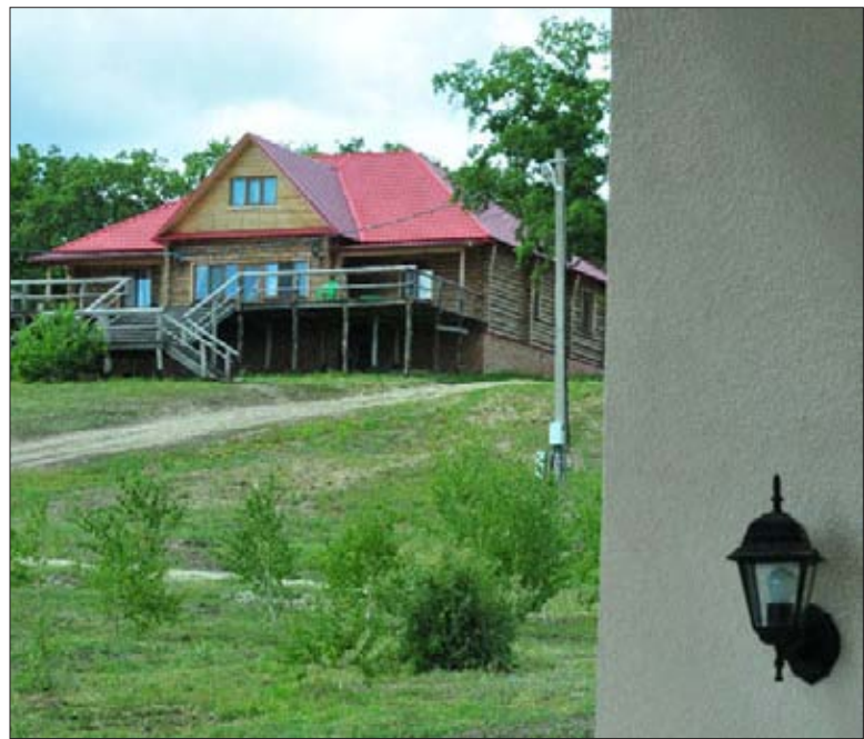
«Хутор Семеновский» ждет гостей в любое время года

Со всеми вопросами обращаться по адресу г. Саратов, ул. Яблочкова, д. 13. Тел./факс: 8 (8452) 30-47-36, 30-47-37. «Хутор Семеновский» расположен в 20 км от села Воскресенское.