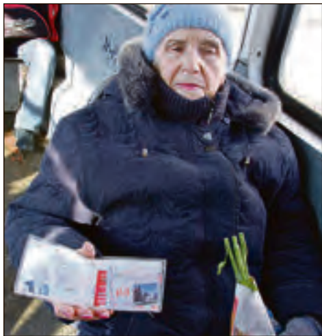
Количество льготников по «официальным данным» уменьшается по мере необходимости