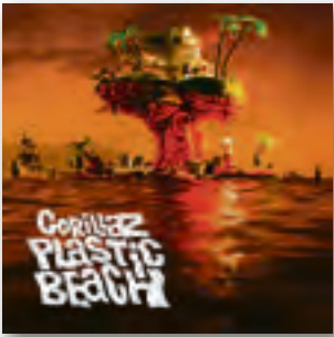
Gorillaz Plastic Beach, 2010

Нет, никогда не доверяйтесь чужому мнению. Вот недавно в ЖЖ близкого человека прочитал, что альбом Plastic Beach — лучший диск этого года. Учитывая, что музыкальные вкусы хвалителя формировались при моём непосредственном участии, взял альбом на заметку. Но слушать в Инете не стал, довольствовался клипом, где вечно живой Брюс Уиллис в вечной маске крутого копа гоняется за мультяшными бандитами.