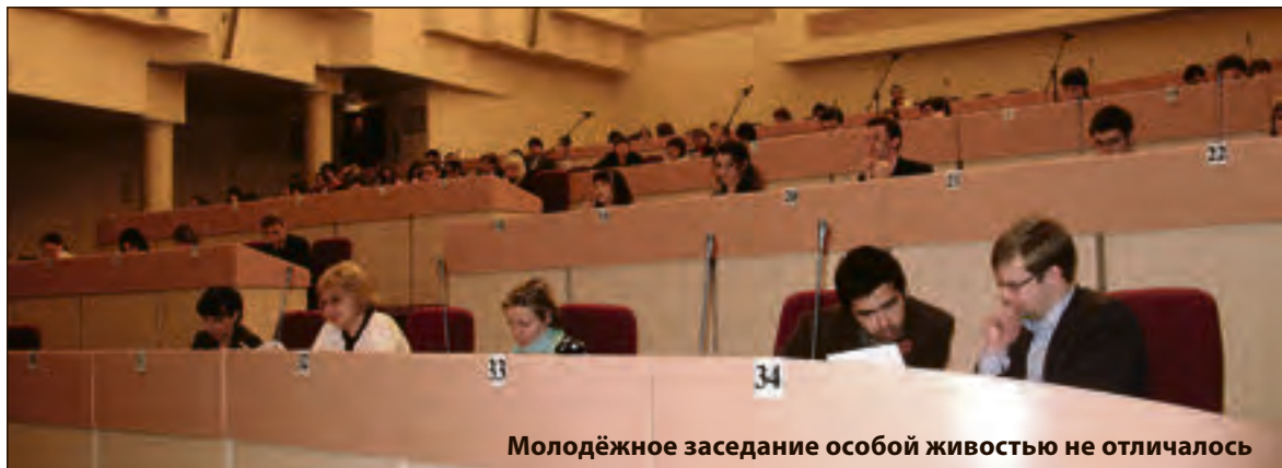
Молодёжное заседание особой живостью не отличалось

Собравшиеся также решили внести изменения в областной закон об административных правонарушениях. Так как ни социальная реклама, ни информационная политика властей проблему алкоголизации молодёжи не снимают, парламентарии решили бороться с проблемой рублём. Они предложили увеличить штрафы за продажу алко-