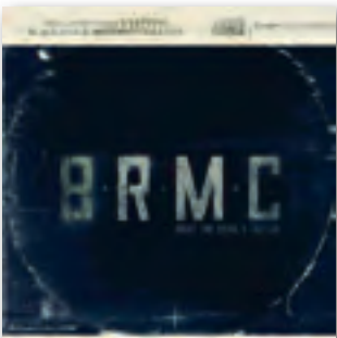
Black Rebel Motorcycle Club Beat The Devil's Tattoo, 2010

Критики продолжают мучиться, куда же им пристроить американское трио. Сначала наклеили ярлык «новая волна гаражного рока», потом — с выходом третьего альбома — посчитали, что BRMC склоняются к блюзу. Четвёртый альбом Baby 81 посчитали реверансом в сторону, прости господи, брит-попа. Группу уверенно продолжают называть молодой, хотя стаж трио уже больше десяти лет, а Devil's Tattoo уже пятый их альбом. Очень неплохой, на мой взгляд, альбом. Хотя начинается несколько монотонно.