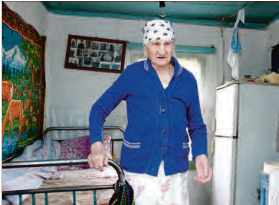
Село продолжает стареть и жить воспоминаниями

Ежегодно получают дипломы более 1,5 тысяч специалистов высших аграрных образовательных учреждений, но всего 200 молодых специалистов устроились работать в село в 2009 году. И это несмотря на то, что этому контингенту увеличили размер единовременного пособия с 50 до 75 тыс. руб. (принят соответствующий областной закон). Кроме того, им положены и до-